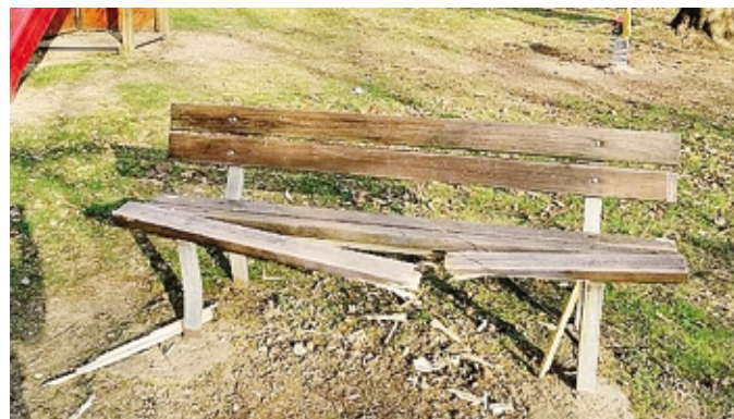
La panchina distrutta dai vandali nel parco