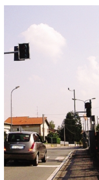
Un tratto di via Risorgimento

Nonostante le denunce continue - tre quelle di domenica ai carabinieri di Cermenate - i ladri non mollano la presa. Vertemate è nel mirino da settimane e l'elenco delle strade dove sono stati segnalati blitz è lungo, da via Monte Bianco a via Roma, via Baroni, via Pra Siria, via Volta, dietro il cimitero di Minoprio. Colpite abitazioni private e anche un'azienda agricola, che si è vista portare via attrezzi per 10mila euro di valore. S. Cat.